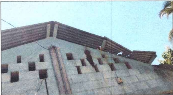
Foto1: Cambio del techado